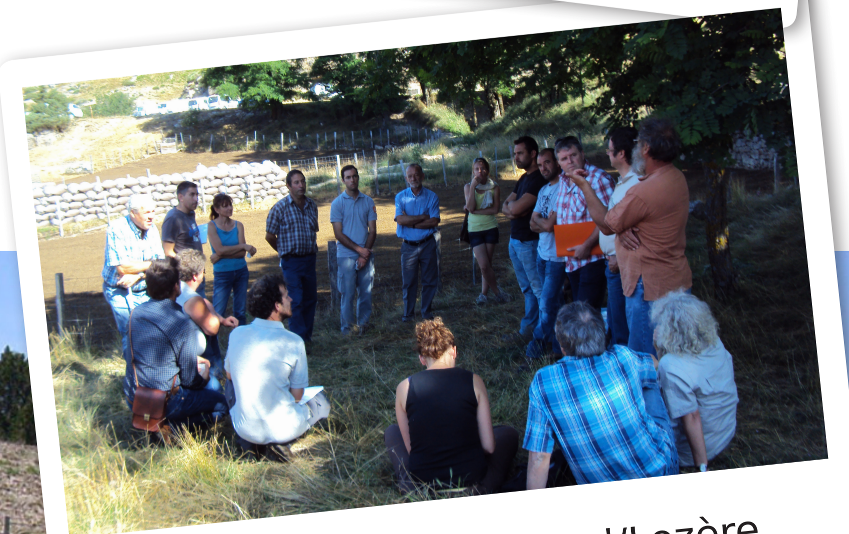
Rencontre des GP Gard/Lozère