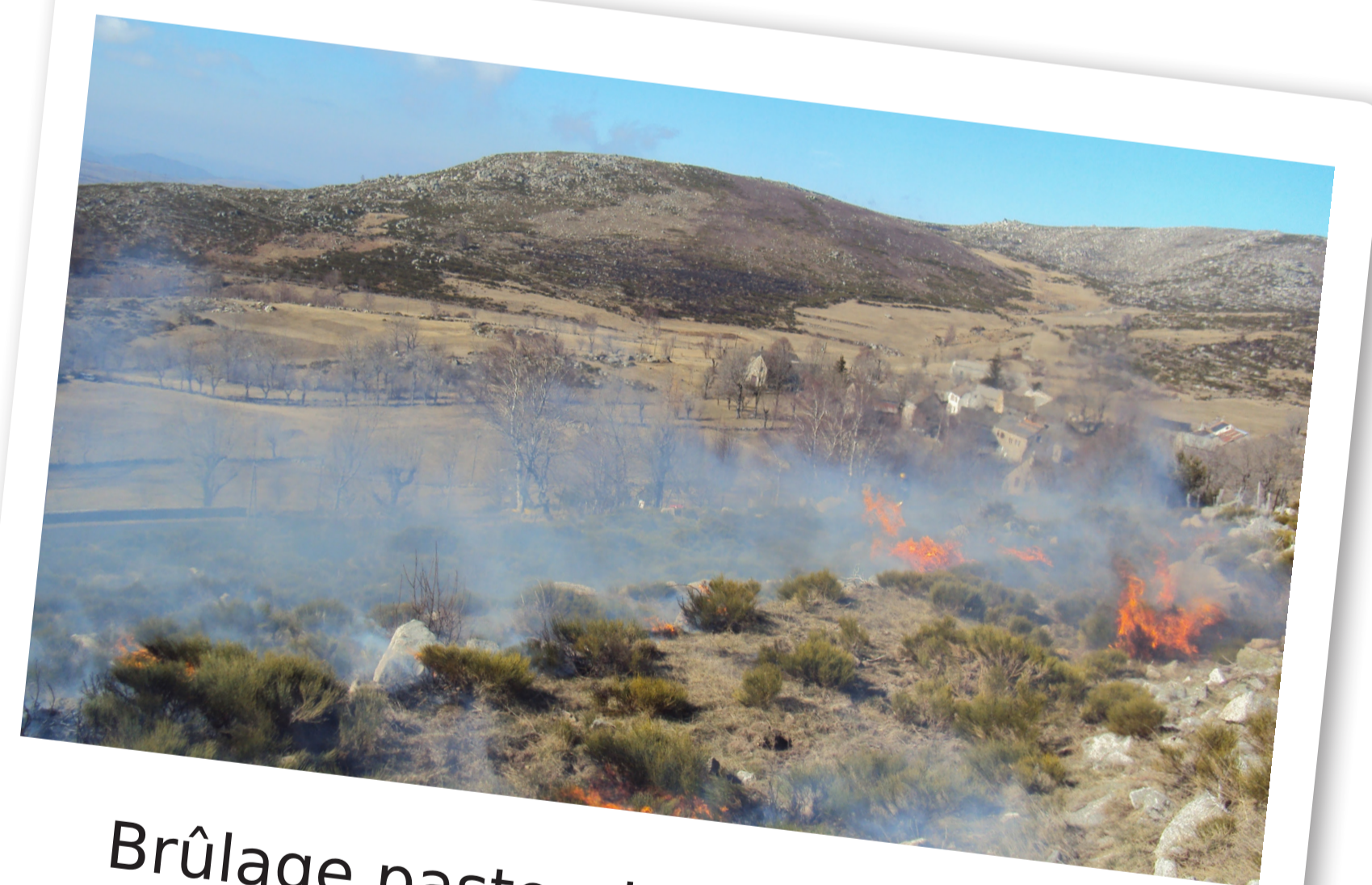
Brûlage pastoral Mont-Lozère