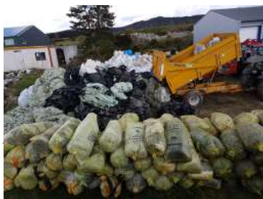
Rieutort-de-Randon, Collecte 2017

Avec un ramassage le jour même, le site a été laissé propre dès le lendemain par le transporteur. La constance de la qualité des dépôts est à souligner à nouveau sur ce secteur (pour les collectes hivernale et printanière) : merci aux participants pour la constance de leur implication.